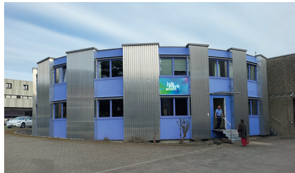
Untere Fischbachstrasse 2